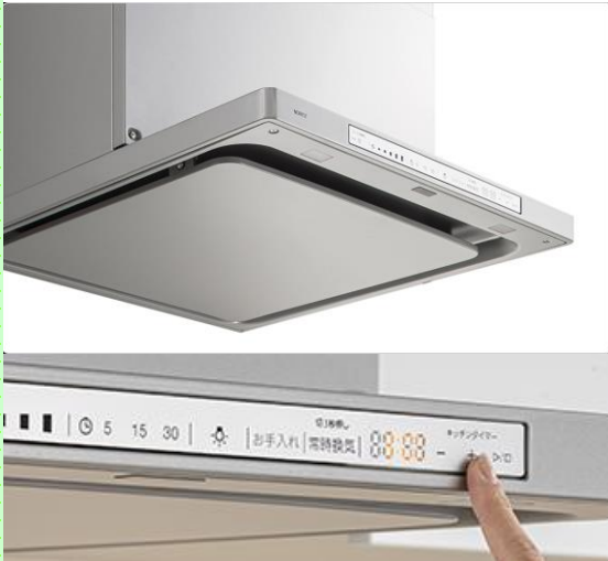
※油回収のイメージ