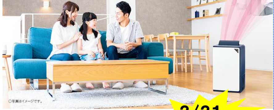
○写真はイメージです。